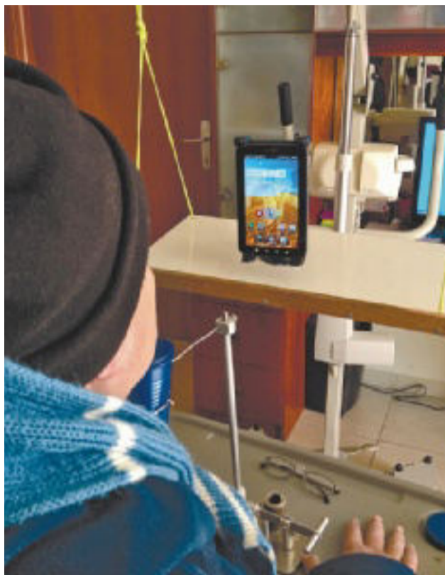
שימוש באפליקציה של Sesame Enable