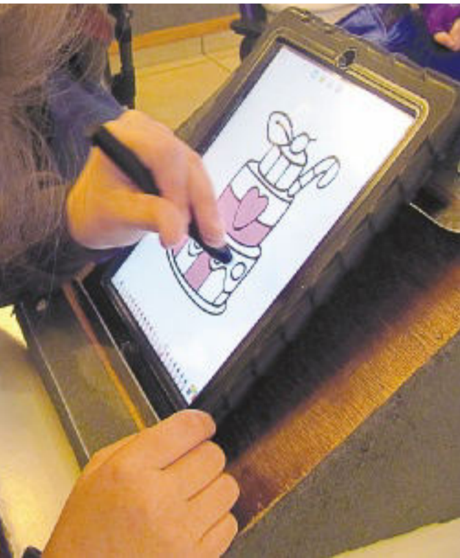
ילדה משתמשת באפליקציה לטיפול בילדים עם מוגבלויות